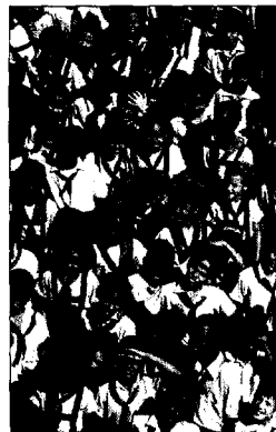
Grundschul Kinder in Santiago de Cuba