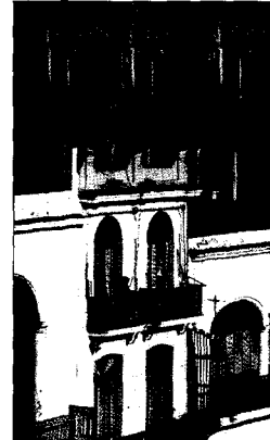
Restaurierte Häuser an der Plaza Vieja, Havanna