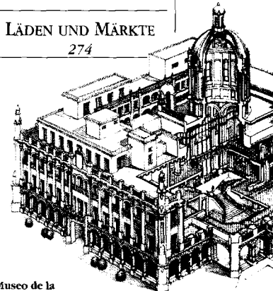
Museo de la Revolución (siehe S. 88f)