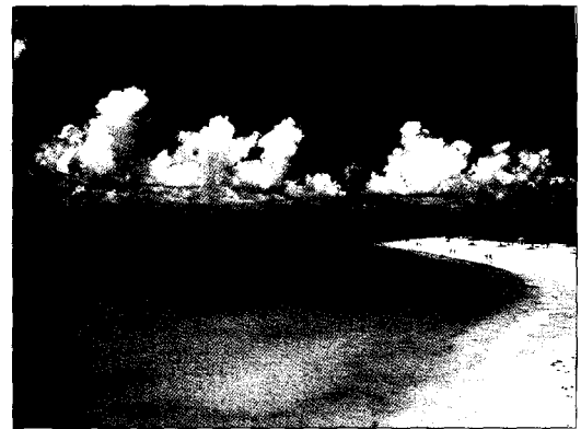
Der Strand von Guardalavaca ist einer der beliebtesten Kubas