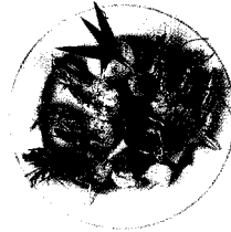
Gegrillte camarones (Garnelen)