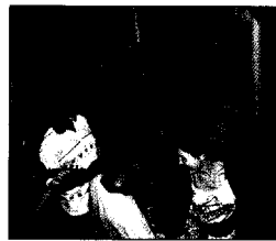
Tanzabend in der Casa de la Tradición in Santiago de Cuba