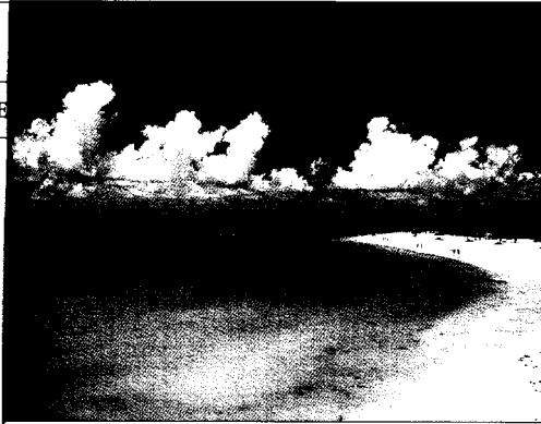
Der Strand von Guardalavaca ist einer der beliebtesten Kubas