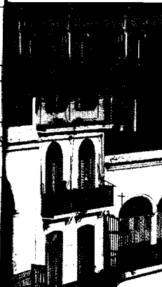
Restaurierte Häuser an der Plaza Vieja, Havanna