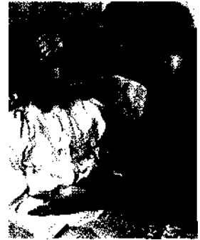
Teebaumöl unterstützt den Abwehrkampf des Körpers gegen Krankheitserreger.