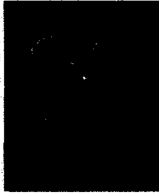
Blüten der Feuerbohne.