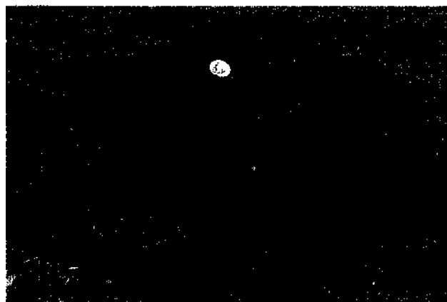
Renault HO von 1921