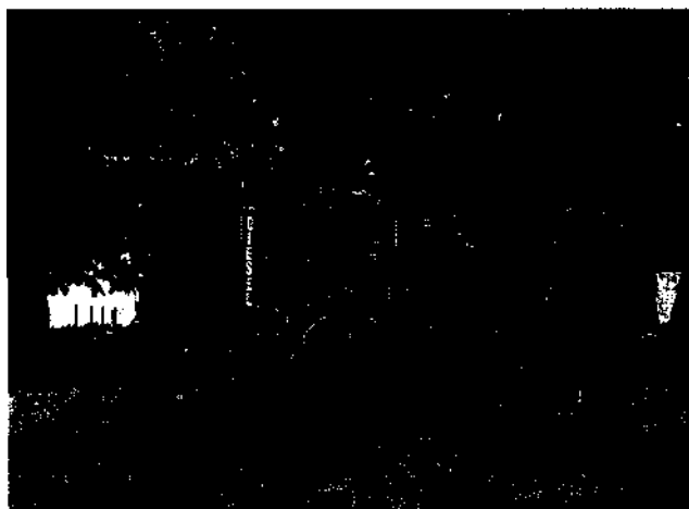
McCormick-Deering WD-40 aus den 30er Jahren