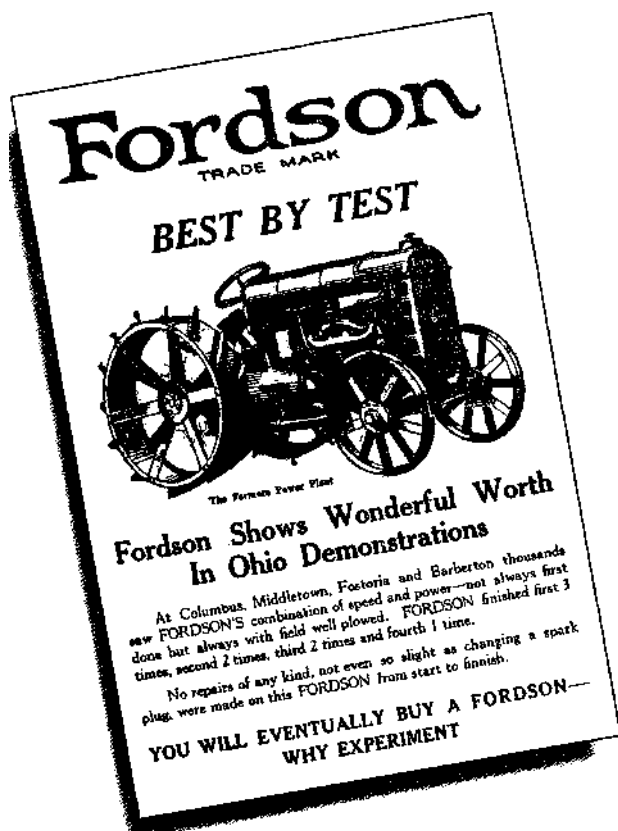
Werbung für Fordson