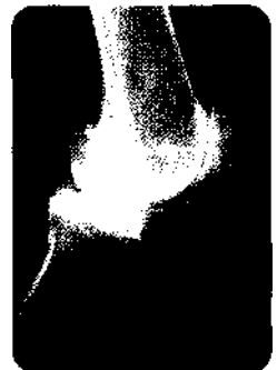
Arthrose - Verschleiß des Gelenkknorpels.