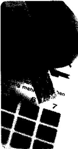
Urin-pH-Wert - mögliches Indiz für eine Übersäuerung.