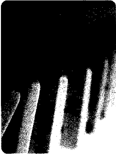
Eine Wirkung erzeugt die nächste Ursache.