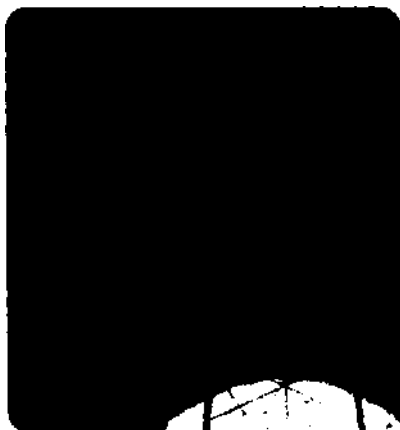
Elektrosmog- eine inzwischen weit verbreitete Bedrohung.