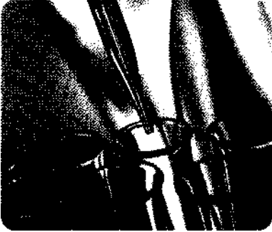
Das Leben - eine Vielzahl chemischer Reaktionen.