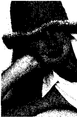
Mit Accessoires farbliche Akzente setzen!