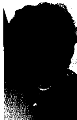
Die perfekte Frisur ganz individuell!