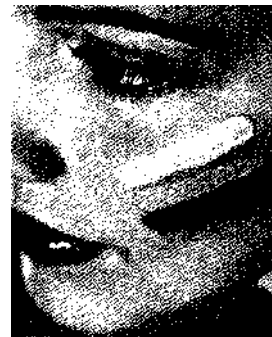
Jetzt klappt's: Schminken wie ein Profi!