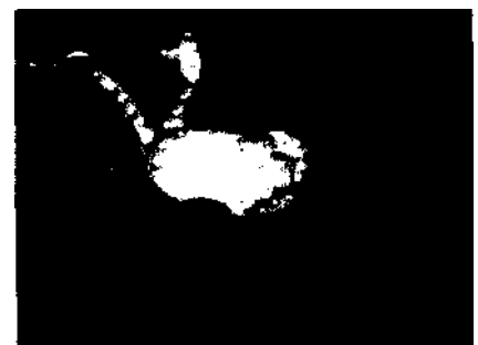
Lichtattrappen sind eine der Attraktionen, mit denen es Blackpool seinen Badegästen gemütlich macht Seite 48