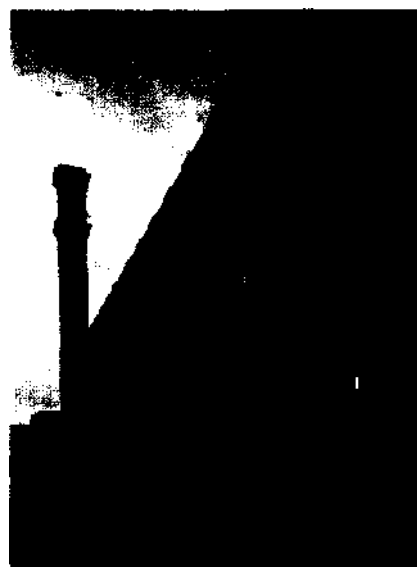
Bradfords stilvolle Fabrik stammt aus dem schönsten Industriemuseum der Welt Seite 120