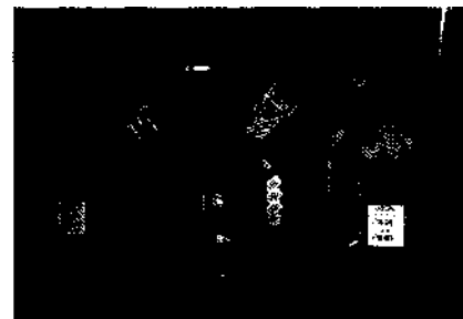
Spielwiese: Geschöpfe der Nacht lieben das Viertel Soho Seite 92