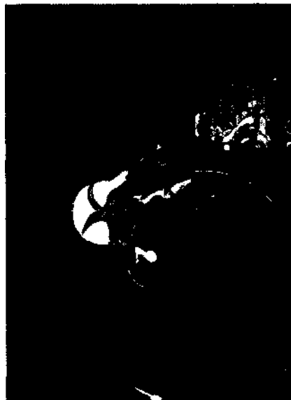
Bacon: Bilder des Schreckens Seite 114