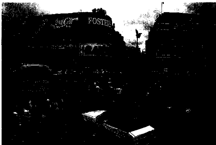
Bermuda-Dreieck: Am Piccadilly Circus toben Verkehr und Leben Seite 16