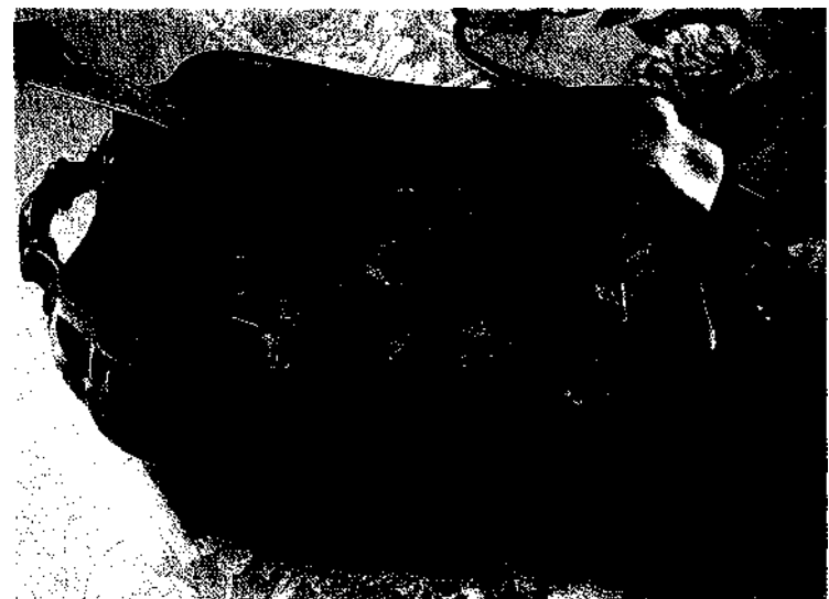
Putensuppe mit Zitronen-Sellerie-Klößchen