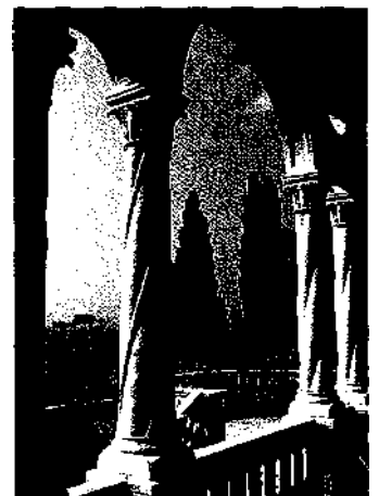
Ausblick auf eine mediterrane Bilderbuchlandschaft - die Villa Hanbury, an der französischen Grenze, liegt in einem der schönsten botanischen Gärten der Welt.

Pasta - mit frischen Zutaten einfach köstlich.