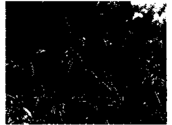
Rote Tupfer in Grün - die »Flaschenputzer«, Calystemon hybrida , gedeihen im Mikroklima der ligurischen Küste hervorragend.