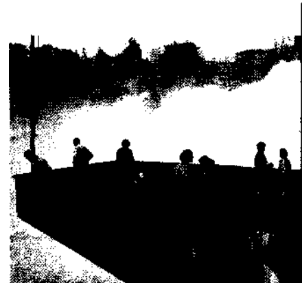
Am Rheinfall von Schaffhausen..86