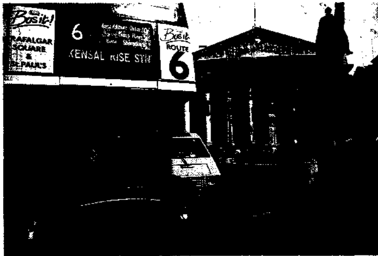
Die acht Säulen der alten Stock Exchange, der Börse.

Auf dem Fließband zu den Kronjuwelen 38 • Der königliche Rabenvater 38 • Das Revier der Royal Watchers 40 • Die Mystik der Monarchie 40 • Im Morning Dress Zur Queen 41 • Einladung mit 8000 Gästen 42