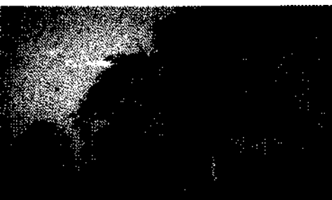
In Afrika heilig: der Baobab (Affenbrotbaum)