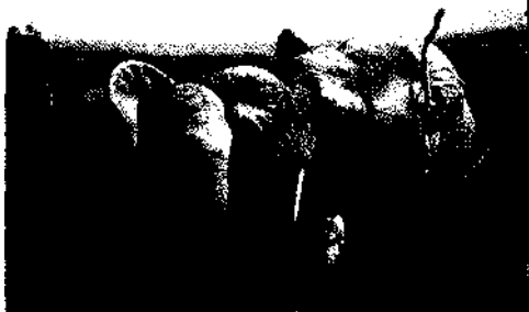
Die >Stars< im Kruger National Park