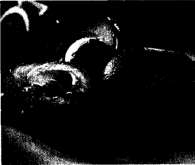
Avocados, Chili und Limetten: die Zutaten für die köstliche Avocado-creme Guacamole.