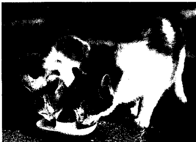
Gesundheit und Wohlbefinden des Haustieres liegen in Ihrer Hand. Achten Sie auf die Bedürfnisse Ihrer Katze.

84 Behandlung von Wunden und Vergiftungen