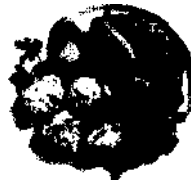
Morena frita — ein typisches Gericht