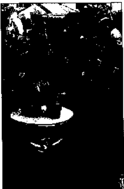
Kinder beim Karneval in Las Palmas de Gran Canaria