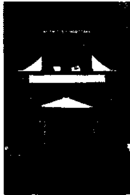
Die Kirche von Vega del Rio de Palma