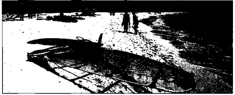
Sandstrand bei Corralejo auf Fuerteventura

DIE GESCHICHTE DER KANARISCHEN INSELN 28