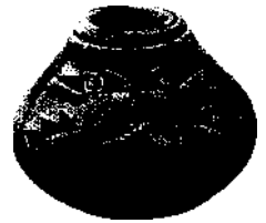
Kerzenhalter aus einer Werkstatt in La Orotava

KARTE DER FÄHRLINIEN Umschlaginnenseite hinten