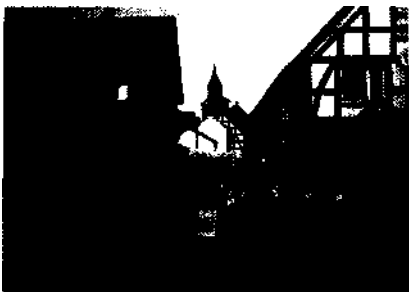
Fröhliches Hessen: Trachten und Blasmusik in Westufflen Seite 14