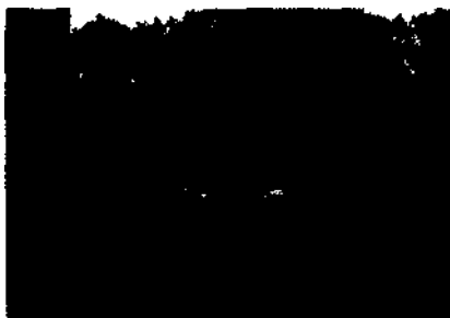
Stille Landschaft: Rheinwiesen bei Keeken im Naturschutzgebiet Düffel Seite 98