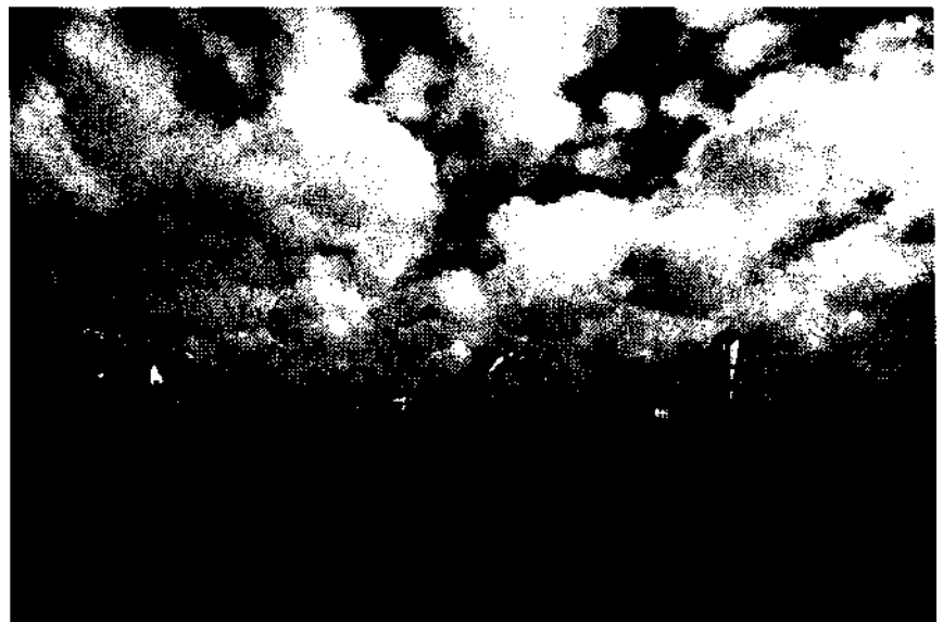
Abschied mit Pauken und Trompeten: Bergmannskapelle Auguste Viktoria, Mari Seite 44