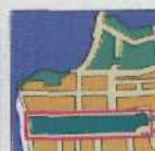
GOLDEN GATE PARK 255