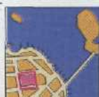
NOB HILL 188