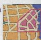
SOUTH OF MARKET 286