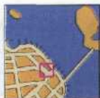
JACKSON SQUARE 146