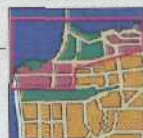
GOLDEN GATE PROMENADE 235