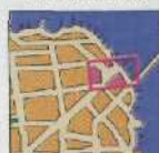
FINANCIAL DISTRICT 206