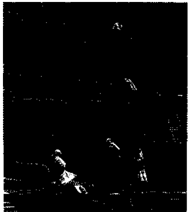
Taos bei Santa Fe - eines der schönsten Pueblos