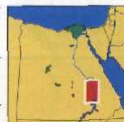
VON THEBEN NACH ASSUAN

Bibliographie 544 Abbildungsverzeichnis 545 Register 553