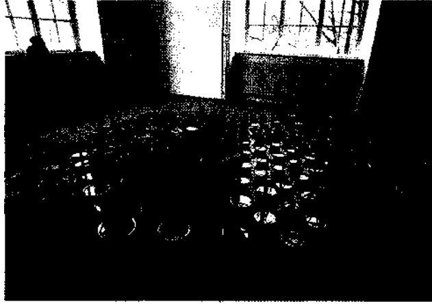
Was ist Kunst? Studentisches Objekt auf der jährlichen Aus- stellung der Akademie.....74

JOSEPH KRUSE Millionen für Heinrich Heine