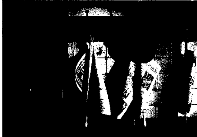
Aufwärtsstrebend: Edelstahl-Brun- nen von Heinz Mack vor der Johanneskirche.....16