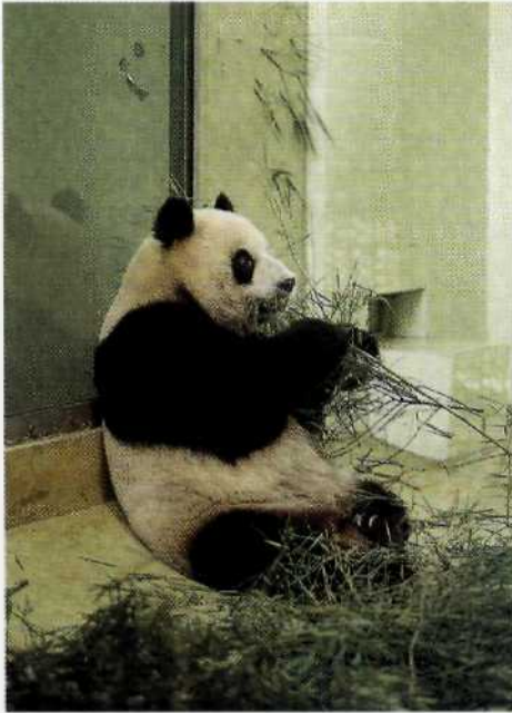
Pandabären sind die Hauptattraktion des Shanghaier Zoos, einem der schönsten Tiergärten Chinas.