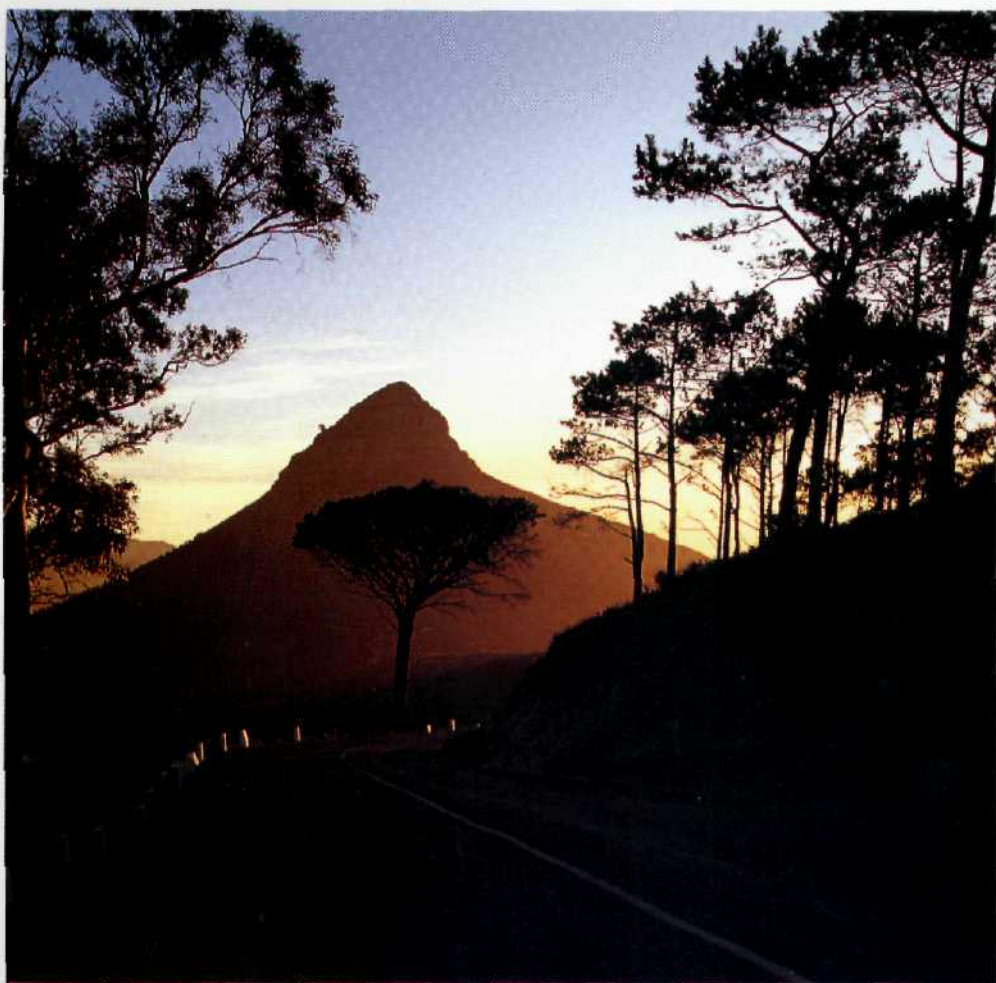
Lionshead bei Kapstadt.