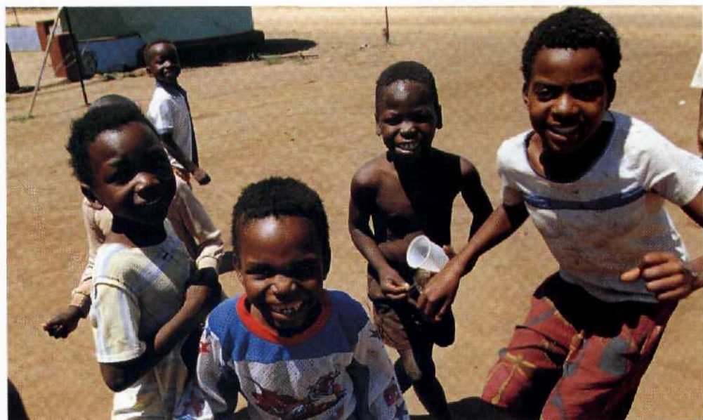
... und seine Bewohner.