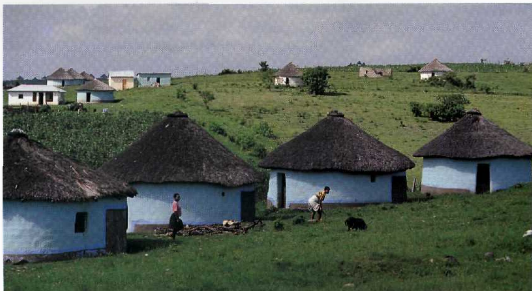
Kral in der Transkei ...