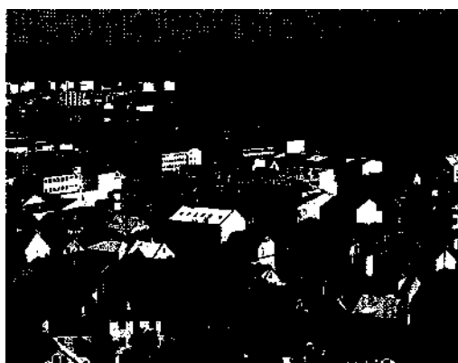
Reykjavik - eine farbenfrohe Stadt.

Aufbruch in die Welt aus Eis 100 • Wenn es dem Eis zu heiß wird 101 Oase zwischen Gletschern 102