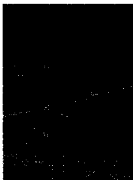
Von Costa Calma zieht sich südwestwärts über viele Kilometer eine traumhafte Strandlandschaft: die Playa de Sotavento.

üteraturempfehlungen 136 • Maße und Gewichte 137 • Mietwagen 137- Museen 137 • Nachtleben 138-Notrufe 138 • Öffnungszeiten 139-Polizei 139 • Post, Telefon 140 • Radfahren 141 • Reisedokumente 141 • Reisezeit 141 • Restaurants 142 • Rundfunk, Fernsehen 146-Sport 147-Sprache 148-Strände 153-Surfen 157-Taxi 158-Tiere 158-