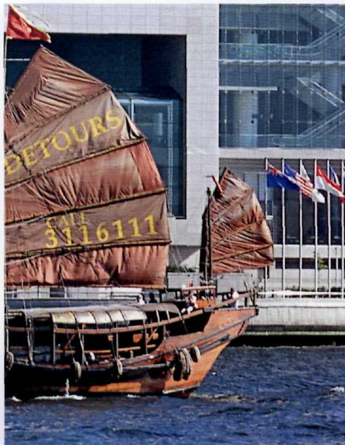
Alt kreuzt neu: Hongkongs letzte Dschunke, die Duk Ling, segelt vor dem Kongresszentrum, den Hotels Harbour View und Grand Hyatt in Wanchai.