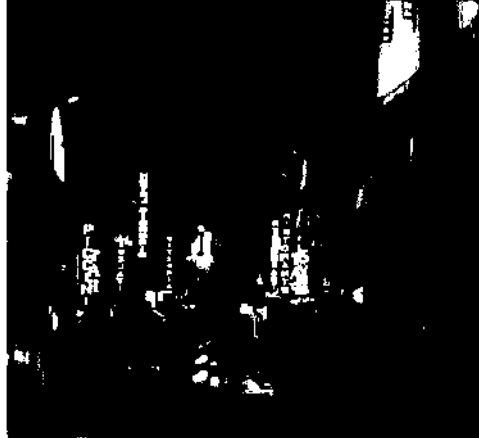
Auf dem Ponte Vecchio (S. 94)