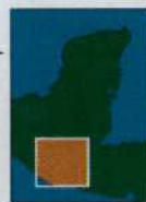
HOCHLAND VON GUATEMALA