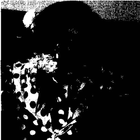
Flamenco - Leidenschaft pur.

Hauptstadt für Genießer 14 • Ein »Hoch« auf Europa 15 • Maurisches »Mayrit« 17 • »So groß wie Biberach ...« 18- Madrids bester »Bürgermeister« 20 • Fortschritt um jeden Preis? 21 • Anfang und Ende des Faschismus 23