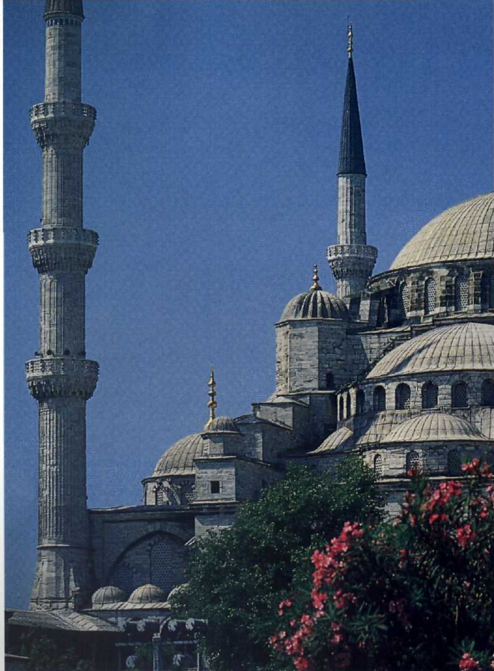
Die architektonische Krone eines weltumspannenden Reiches: die Blaue Moschee.