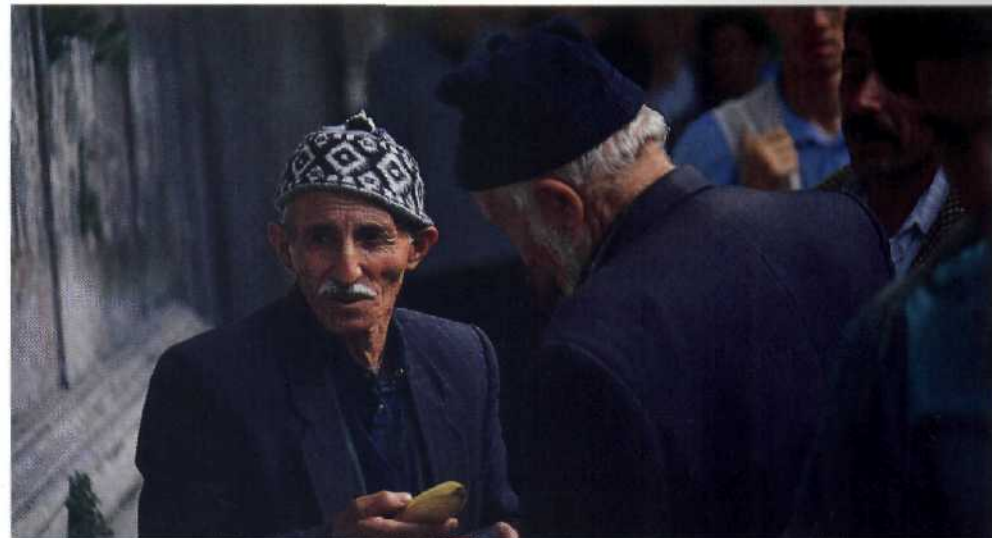
Das alte und neue Gesicht der Stadt: Zuwanderer aus den Dörfern Anatoliens.