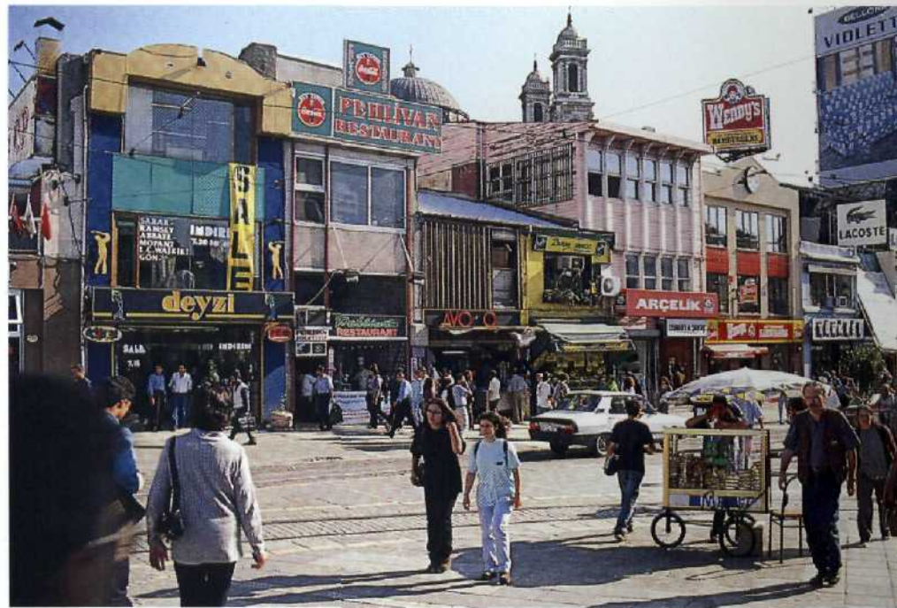
Hier schlug schon immer das europäische Herz Istanbuls: der Taksim-Platz.