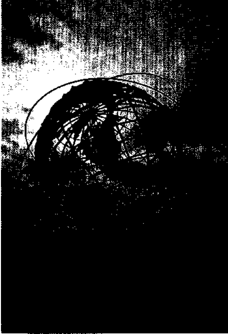
Queens: On the way...