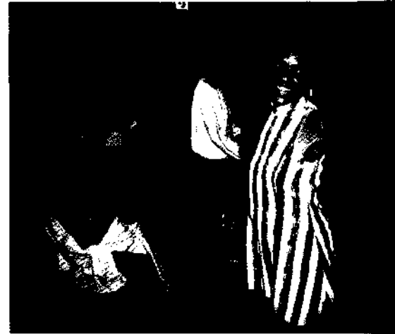
Musik ist überall: Straßenfest in Holguin.