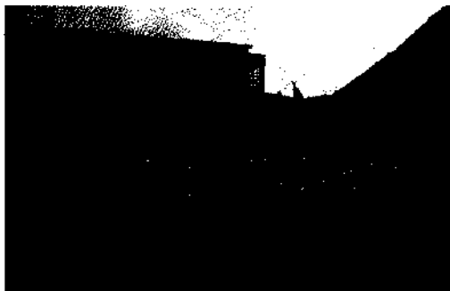
Alles inklusive: Hotelanlage auf Cayo Coco.