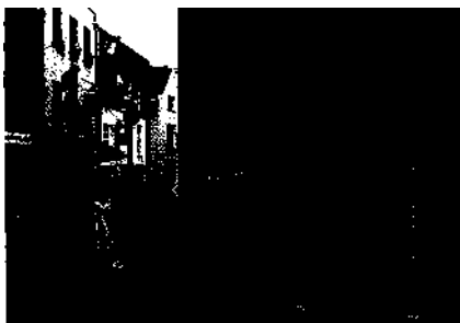
36 Dublin: Temple Bar wird jeden Tag bunter