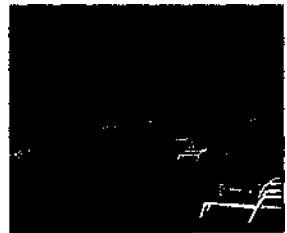
Erholung am Strand von Dahab ▶ S. 502