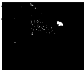
Am Nassersee: der Tempel von Kalabscha ▶ S. 291