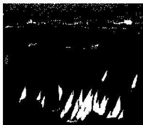
Assuan, die Schöne im Süden Agyptens ▶ S. 191