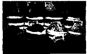
Gewürzparadies: der Souk ▶ S. 193