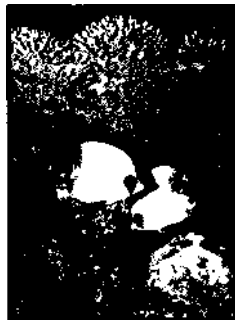
Korallenriffe im Roten Meer ▶ S. 369

Abu I Abusi Alexa Amac Antoi Bahai Beni j Dach Dahsl El-Ala El-Kal El-Lab Esna Kalab Kharj Kom