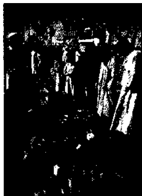
Auf dem Markt in der Oase Siwa ▶ S. 409