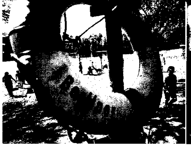
18 Einblicke: Wochenendvergnügen am Schlachtensee