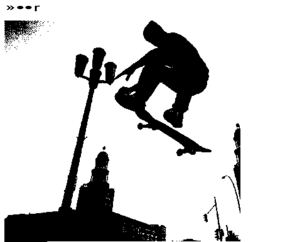
154 Szeneviertel Friedrichshain: Skateram Frankfurter Tor