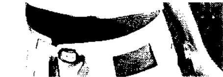
102 Tausend Ideen: Für die jungen Wilden ist Berlin eine Stadt der unbegrenzten Möglichkeiten