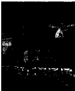
Märchenschloss Egeskov ▶ S. 124