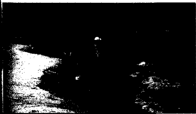
Dänemarks Strände sind ein Traumziel für Familien. ► S. 292