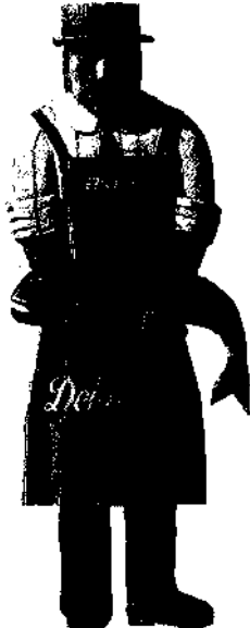
Spezialität: fangfrischer Fisch ▶ S. 297