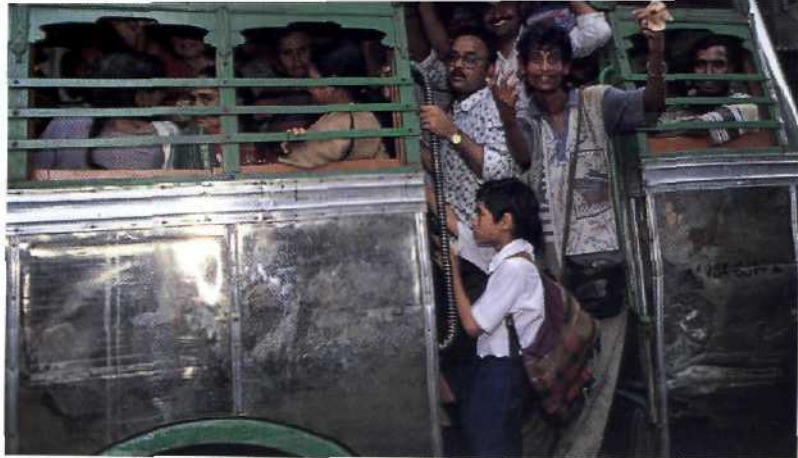
Gut besetzter Bus in der Millionenstadt Kalkutta.