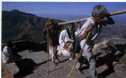
Aufstieg zum Tempelberg von Palitana, Gujarat.