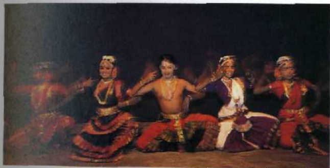
Traditioneller Tanz bei einem Tempelfest in Kochi/Kerala.