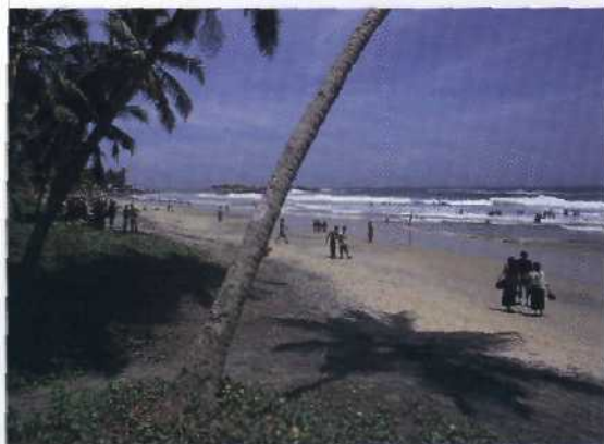
Palmengesäumter Strand: Kovalam Beach.