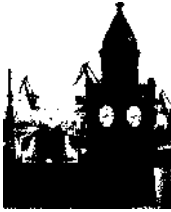
TITEL: Der Hafen vor den Landungsbrücken