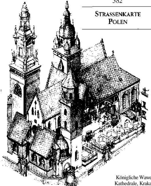
Königliche Wawel-Kathedrale, Krakau