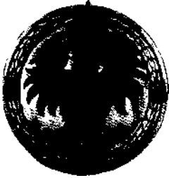
Der Adler, Wahrzeichen Polens, in der Zygmunt-Kapelle, Krakau