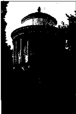
Klassizistische Rotunde in den Sächsischen Gärten in Warschau