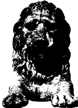
Löwe am Namiestnikowski-Palast in Warschau