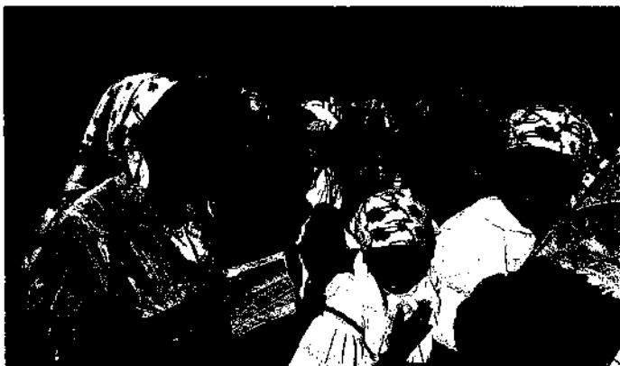
Festtage sind Tage der Rückbesinnung auf altes Brauchtum.