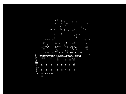
Château Frontenac in Quebec