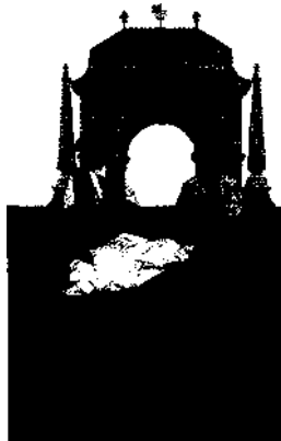
Die rekonstruierte Fortress Louisbourg, Nova Scotia

NEW BRUNSWICK, NOVA SCOTIA UND PRINCE EDWARD ISLAND 70