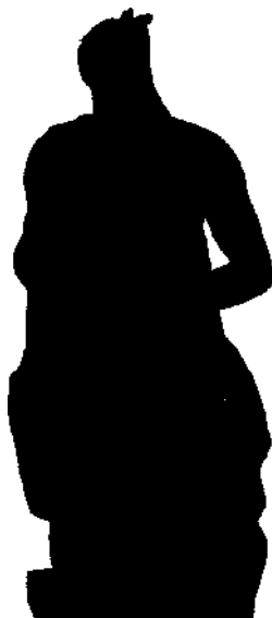
Moses von Michelangelo In San Pietro in Vincoli