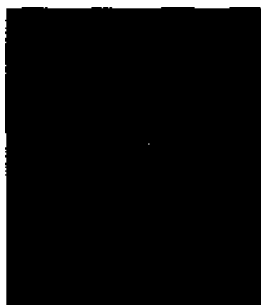
Mosaik In Santa Prassede