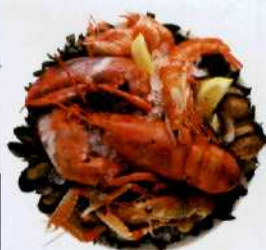
Meeresfrüchte stehen auf vielen Speisekarten