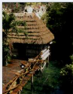
Maya-Dorf im Themenpark Rancho Xcaret auf der Halbinsel Yucatán