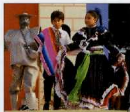
Straßenkünstler auf der Plaza Cívica, Tuxtla Gutiérrez