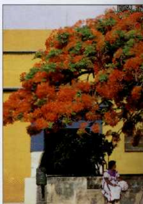
Plaza Santo Domingo in Oaxaca

◀ Die Maya-Stätte Tulum auf der Halbinsel Yucatán