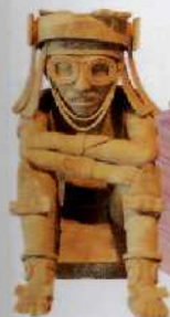
Tlaloc-Statue in Xalapa, Museo de Antropología