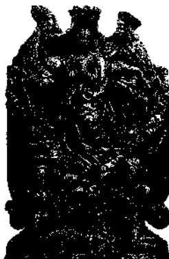
Grabstein in der Kirche von Maria Saal in Kärnten