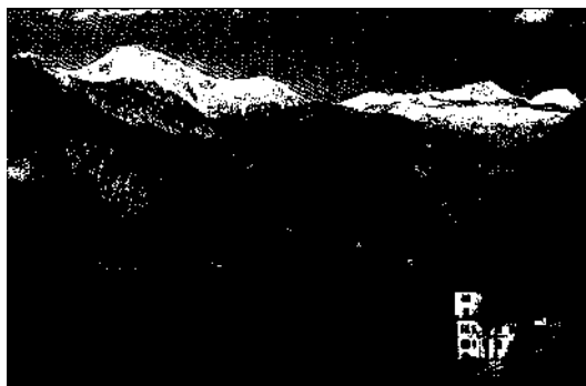
Der Grundlsee und das Tote Gebirge, Steiermark