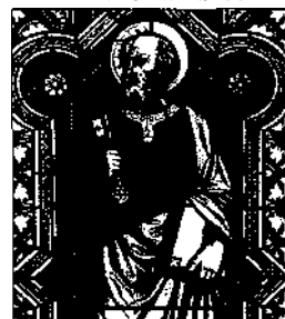
Buntglasfenster in der Kirche von Bürserberg, Vorarlberg