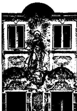
Fassade einer Apotheke in Obenberg, Oberösterreich