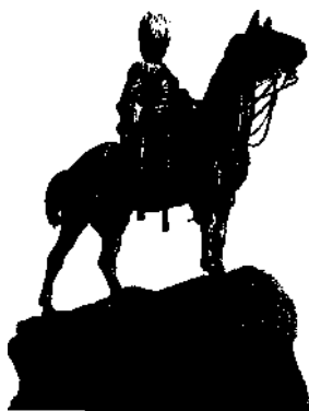
Royal-Scots-Greys-Denkmal für die Soldaten des Burenkrieges