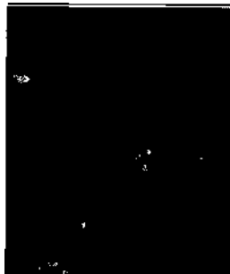
Wanderer unternehmen eine Tour im Gebiet des Glen Etive