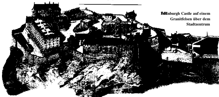
Edinburgh Castle auf einem Granitfels über dem Stadtzentrum