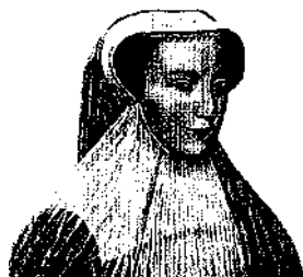
Mary, Queen of Scots (1542-1587), aus dem Hause Stuart