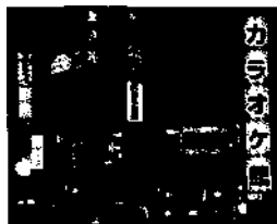
Neonschungel im Roppongi-Distrikt, Westtokyo