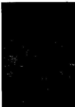
Burg Matsumoto, Japanische Alpen