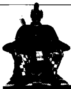
Kaiserfigur am Yomeimon-Tor, Tosho-gu-Schrein, Nikko