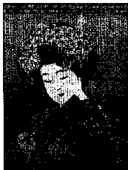
Wandbehang mit Geisha-Motiv in einem Museum in Takayama