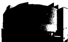
Opera de Paris Bastille