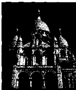
Sacre-Coeur auf Montmartre