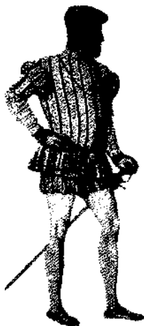
Henri II (1547-1559)