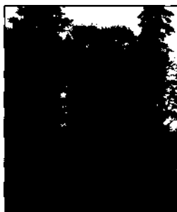
Insel im Bois de Boulogne