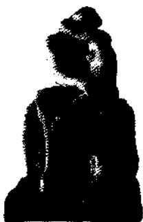
Der Kuss von Rodln (1886)