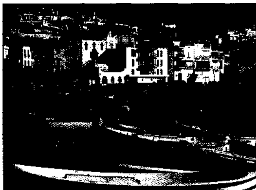
Das Städtchen Cadaques mit seinen weißen Häusern an der Costa Brava