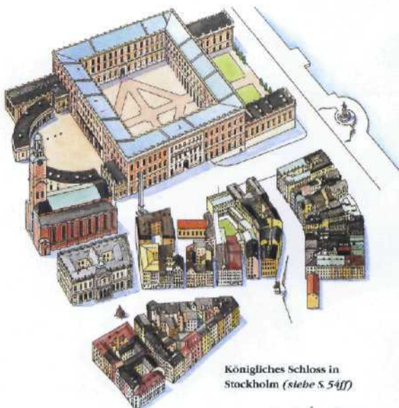
Königliches Schloss in Stockholm (siehe S. 54ff)