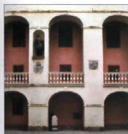
Innenhof des Läckö Slott, Västergötland (siehe S. 220)