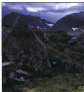
Wollgrasblüte in den Bergen von Sylarna

Dorling Kindersley Verlag GmbH Redaktion Reiseführer Gautinger Str. 6 D-82319 Starnberg