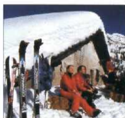
Rast beim Wintersport auf dem Åreskutan (siehe S. 259)