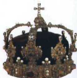
Krone von Erik XIV., Schatzkammer im Königlichen Schloss, Stockholm