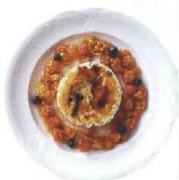
Käsekuchen mit Moltebeeren, ein echt schwedisches Dessert